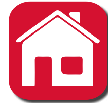
Mein Haus / Meine Wohnung

CF DIE OSTFRIESISCHE LANDSCHAFTLICHE BRANDKASSE Die Versicherung der Ostfriesen