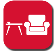
Mein Hab und Gut